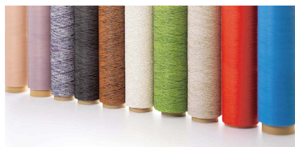
▲当社独自の2色塩ビコーティングがされた糸。床材やオーニング、防草シートなどに使われます。